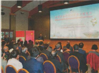
■“走进首届中国国际进口博览会”主题招待会。