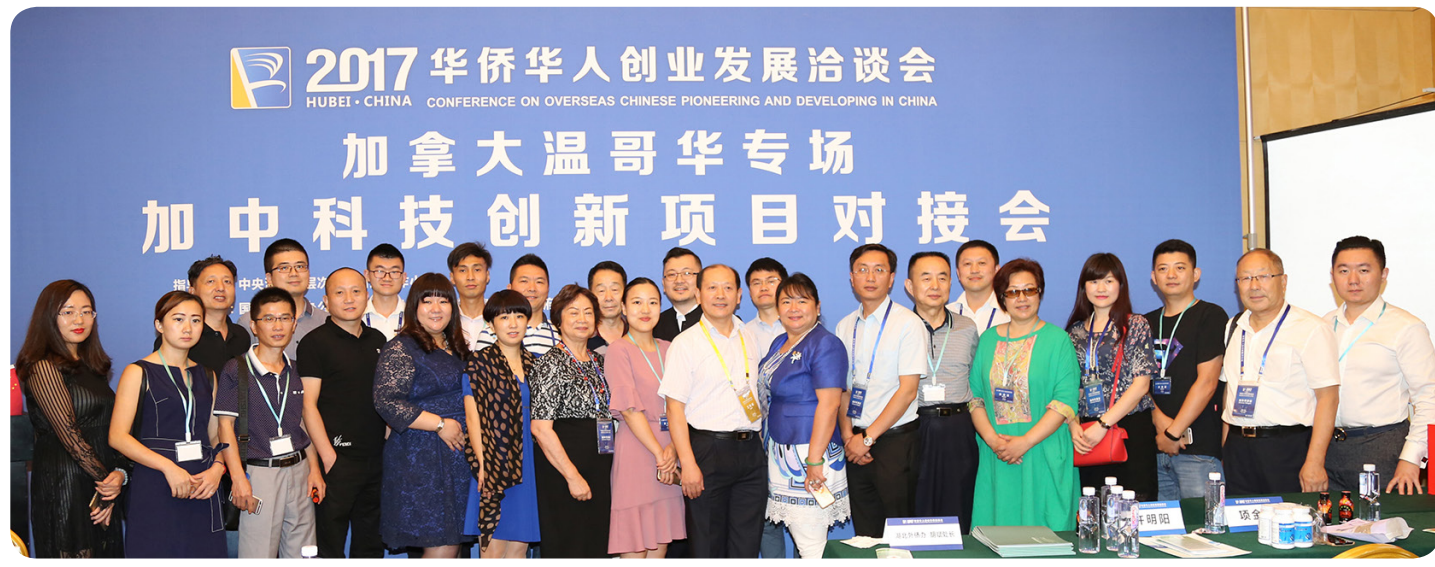
speakers, organizer chief, Canada Federal Gov Rep at Wuhan, coop partners at the forum