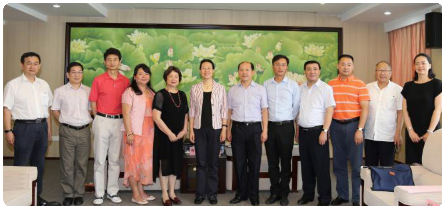
rcvd by President of Hubei Provincial Commerce Division