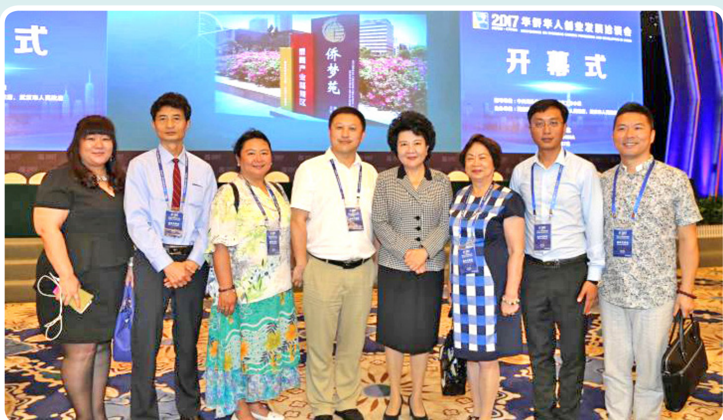
我会参会全体成员与中国国侨办裘援平主任合影

继2016年参加第16届华侨华人创业发展洽谈会之后，加拿大国际贸易促进会于2017年7月再次组团参加第17届华创会，取得了圆满成功。