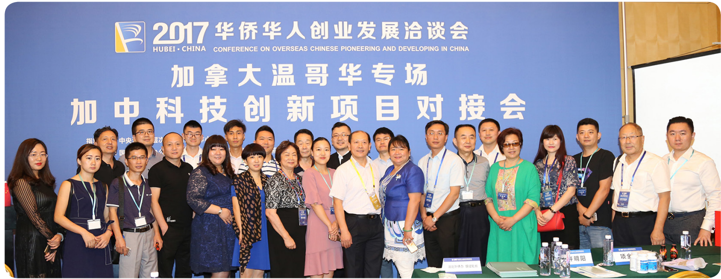
我会专场论坛所有演讲嘉宾、华创会组委会领导、加联邦政府驻当地首席代表与战略伙伴合作单位工作人员合影

本届华创会由国务院侨办、湖北省政府及武汉市政府共同主办，于2017年7月8日在武汉东湖国际会议中心开幕，国务院侨务办公室主任裘援平，湖北省委书记、省人大常委会主任蒋超良，中央组织部副部长周祖翼等在开幕式上分别致辞。今年华创会的主题是“万侨创新，发展共享”。大会吸引了来自海内外4000余名代表参会，其中海外代表1661人，来自72个国家和地区，海外代表人数及国家和地区数均创历史新高。今年共有777个海外项目参会，涉及投资贸易、生物医药、IT光电子、节能环保等多个领域，并达成134个项目协议，投资总额超632亿元。